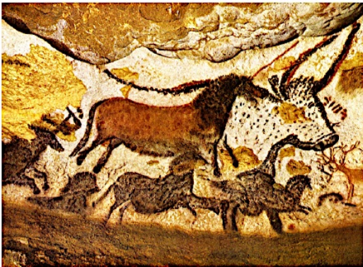
Salle des Taureaux Grotte de Lascaux

On appelle préhistoire le temps où les hommes ne savaient pas encore écrire. Ils faisaient des dessins sur les murs.