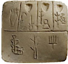
Tablette archaïque, Musée du Louvre

Il y a 6000 ans, des marchands ont eu besoin de se souvenir de leurs comptes : ils ont inventé un système leur permettant de noter ce qu'ils avaient.