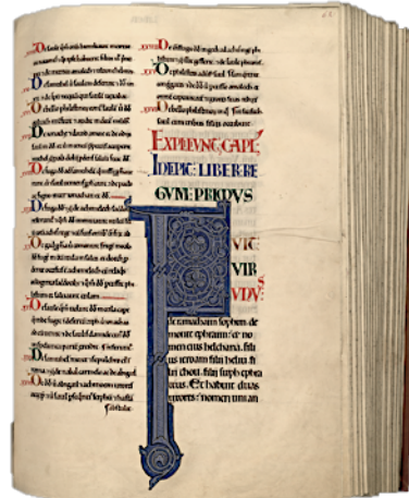
Grande Bible de Clairvaux Médiathèque de Troyes

Au Moyen-Age, les premiers livres sont apparus, ils étaient écrits à la plume sur des pages de parchemin par les copistes.