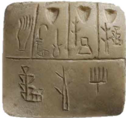
Tablette archaïque, Musée du Louvre

Il y a 6000 ans, des marchands ont eu besoin de se souvenir de leurs comptes : ils ont inventé un système leur permettant de noter ce qu'ils avaient.