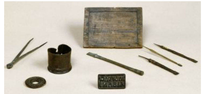
Matériel d'écriture gallo-romain, Musée archéologique de Saint-Germain-en-Laye

Ecrire est devenu plus facile : on pouvait apprendre en gravant des tablettes de cire .