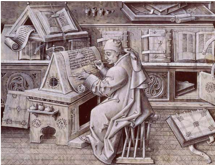
Jean Méliot, Miracles de Notre-Dame , milieu XVe siècle. Bibliothèque nationale de France

Pour dessiner sur les murs des grottes, ils utilisaient du charbon , ou des roches colorées comme l' ocre .