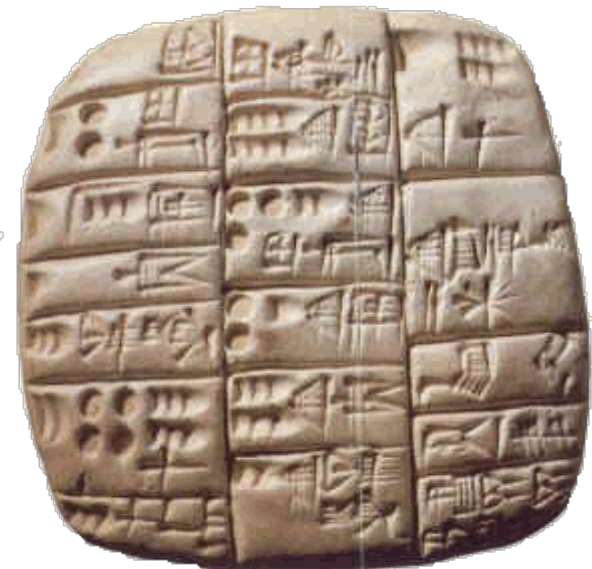
Tablette de Lagash Musée du Louvre