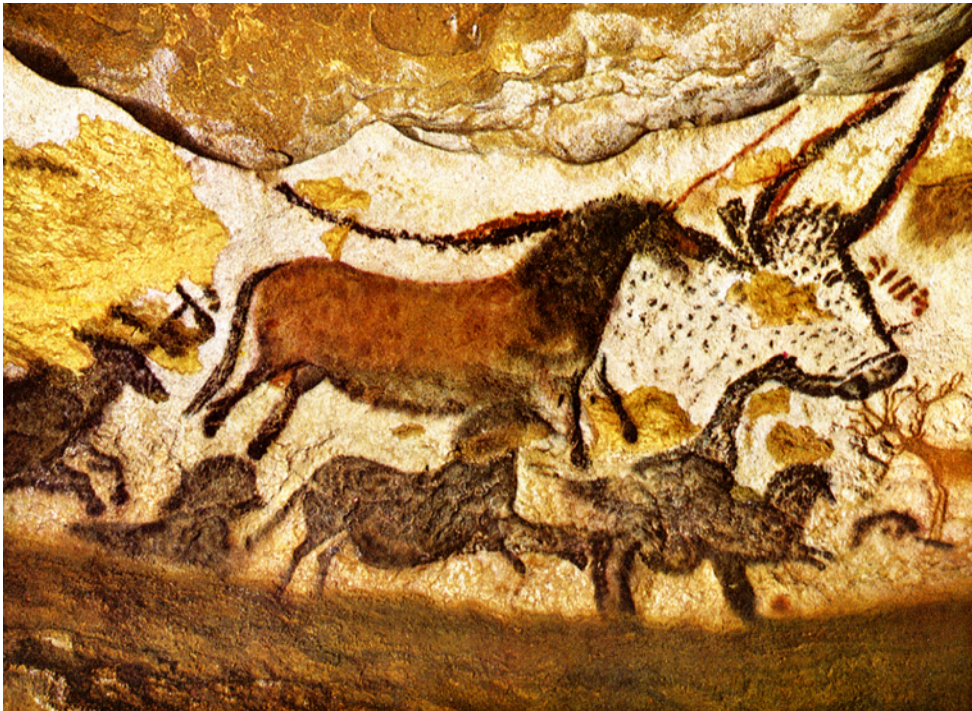
Salle des Taureaux Grotte de Lascaux

On appelle préhistoire le temps où les hommes ne savaient pas encore écrire. Ils faisaient des dessins sur les murs.