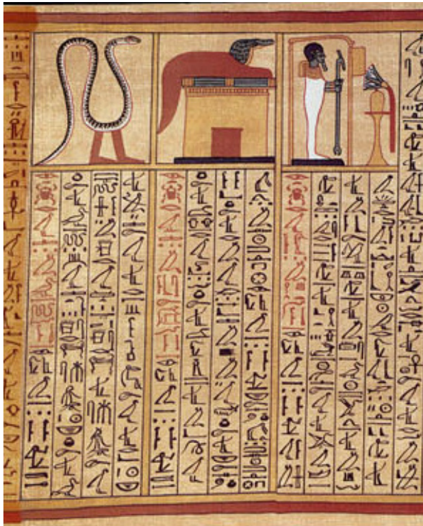
Formules des transformations du Papyrus d'Ani, British Museum

Le scribe écrivait sur du papyrus , une sorte de papier fabriqué avec des roseaux, avec un pinceau en roseau et de l' encre .