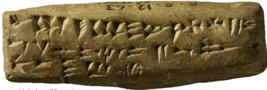
Alphabet d'Ougarit Musée national de Damas

Il y avait 22 consonnes, pas de voyelles.