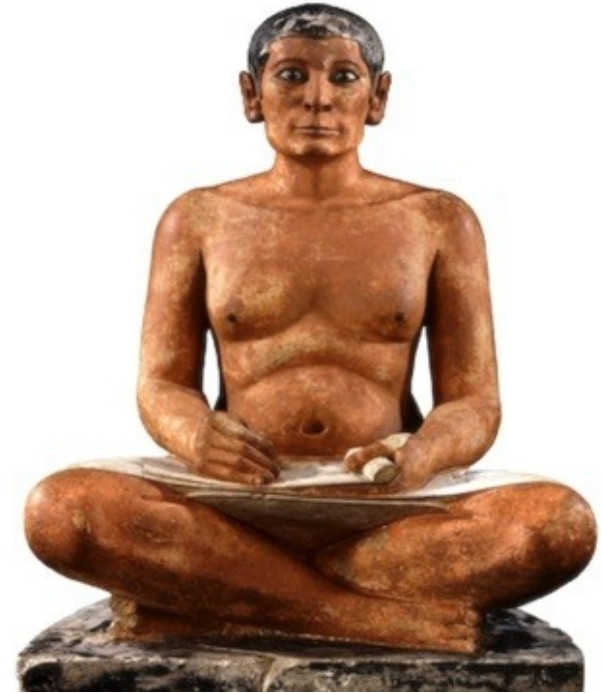
Le scribe accroupi Musée du Louvre