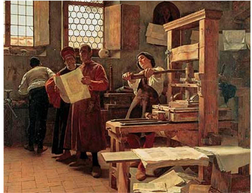
Bernardino CENNINI prototypographe de Florence, et son fils, par Tito Lessi. Galerie d'Art Moderne, Paris

Puis, Gutenberg a inventé l'imprimerie , qui permet d'imprimer rapidement la même page sur des feuilles de papier . On pouvait ainsi plus facilement fabriquer des livres .